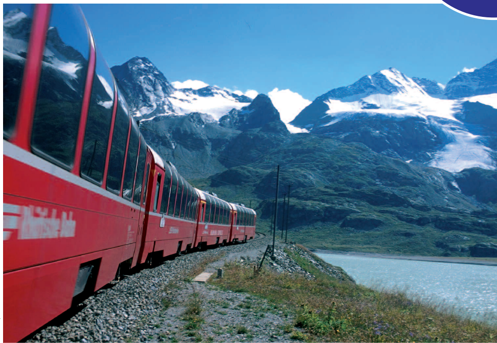
Bernina Expressen.