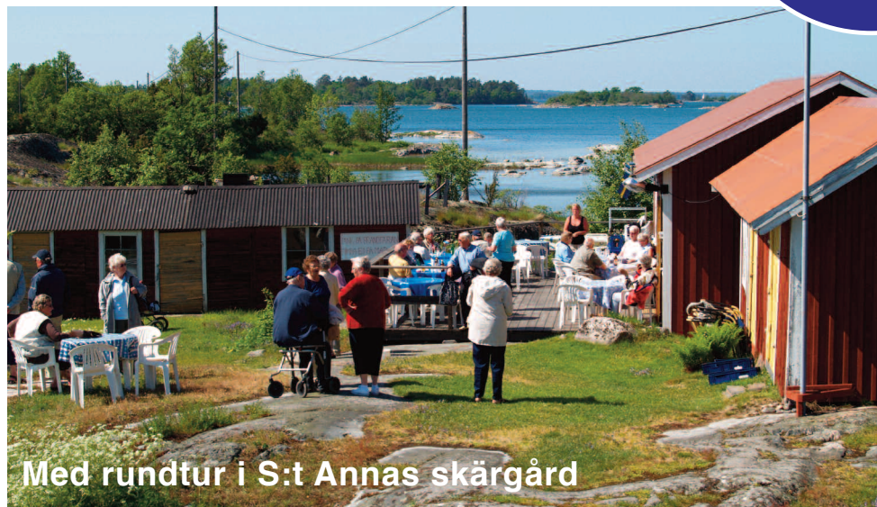
Med rundtur i S:t Annas skärgård