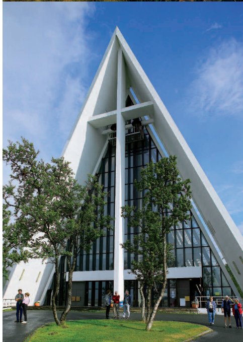
Arctic Cathedral.