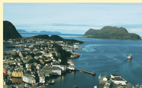
Aksand Innvasjon. Nigra.